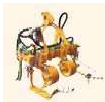
На заднее шасси