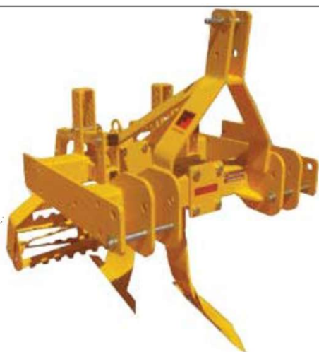
Плуг для создания бороздок