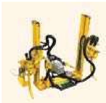
На шасси между колес