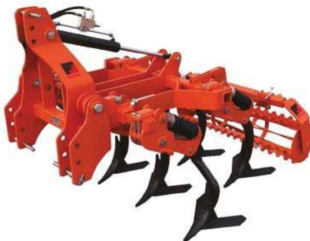
Плуг для глубокого взрыхление почвы