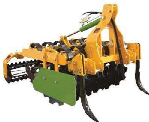
Плуг с измельчителем листвы и веток