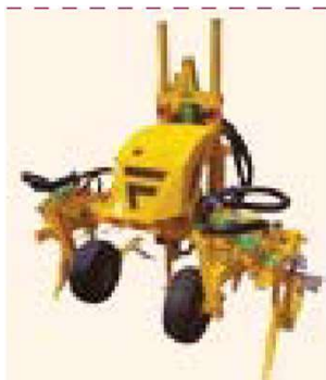
На переднее шасси