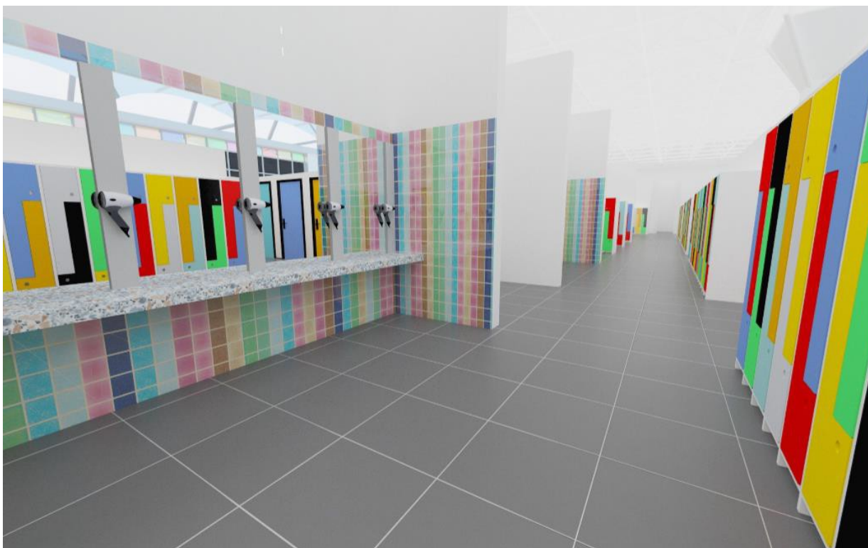
Рисунок 1 - Концептуальный вид проекта