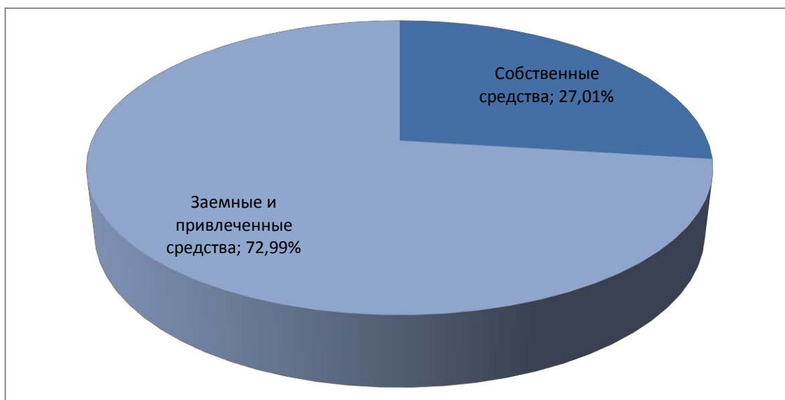
Рисунок 3 - Структура финансирования проекта

Для реализации проекта предполагается использование как собственных, так и заёмных средств. Планируется получение займа в размере 273 436 тыс. рублей под 12% годовых. Срок возврата займа – 4 кв. 2022 года.